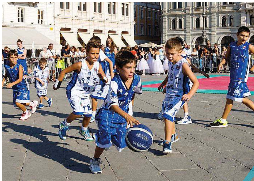
Giovanissimi cestisti Sgt in piazza Unità. Determinante ora il coinvolgimento di Regione e Fondazione CRTrieste